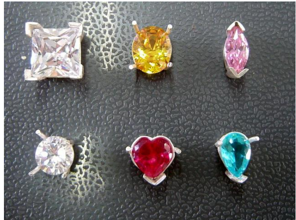
ผลงานเครื่องประดับของนักเรียน