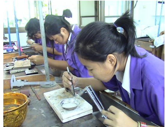
กิจกรรมการเรียนการสอน